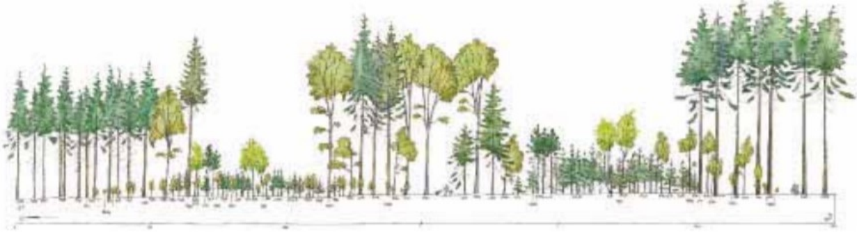
Illustration: Eksempel på langsigtet skovudvikling - Douglasgran, rødgran og bøg

Suppleres/erstattes med link til animation af bevoksningsudviklingen i de første 30 år i 2. udgave.