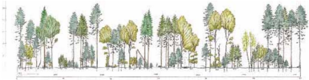
Illustration: Eksempel på langsigtet skovudvikling - Ædelgran med douglas og bøg

Lokalitet: Jordbund: Er tolerant overfor varierende jordbundstyper. Udvikler sig dog ikke godt på mosebund. Løv og kvas er jordbundsforbedrende idet det omsættes hurtigt Nedbør og vandforhold: Ædelgranen udvikler sig bedst hvor nedbøren er gunstig og bør ikke plantes i de tørreste områder af landet Salt: Tåler salt i luften og dermed en kystnær beliggenhed Vind: Er udsat for stormfald, men anses generelt for mere stormstabil end f.eks. rødgran og sitkagran. Er væsentligt mere stabil end douglasgran indtil alder 50 år. Frost: Meget følsom overfor forårsnattefrost. Bør ikke etableres på frostfølsomme lokaliteter. Vildt: Almindelig ædelgran efterstræbes særdeles meget af vildtet.