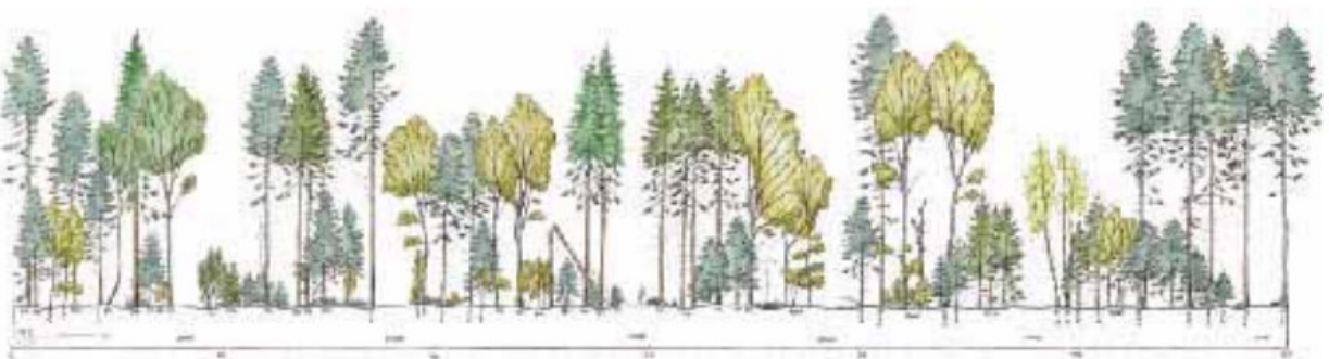
Illustration: Eksempel på langsigtet skovudvikling - Grandis/ædelgran med douglas og bøg

Suppleres/erstattes med link til animation af bevoksningsudviklingen i de første 30 år i 2. udgave.