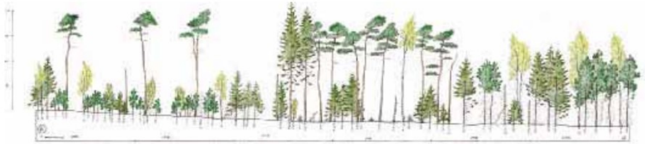
Illustration: Eksempel på langsigtet skovudvikling - Skovfyr, birk og rødgran.

Suppleres/erstattes med link til animation af bevoksningsudviklingen i de første 30 år i 2. udgave.